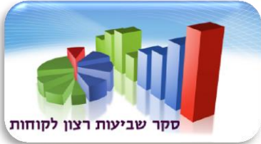
סקר שביעות רצון לקוחות